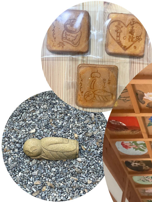
この寝そべっているお地藏さんは？